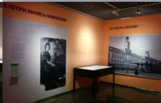
SALA 2 El Rayo que no cesa