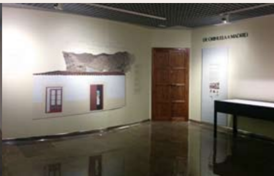
SALA 1 Perito en lunas