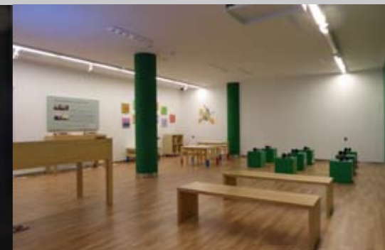
SALA 5 El legado del poeta (Miguel Hernández vuelve a Jaén)