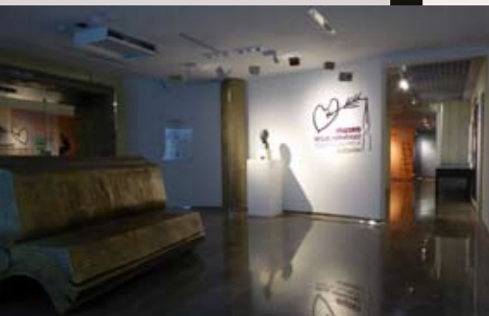
SALA 0 Área de acogida