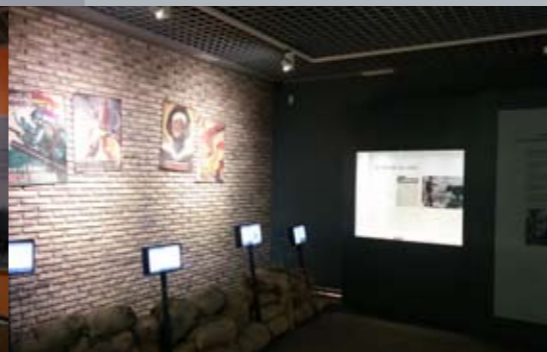
SALA 3 Viento del pueblo